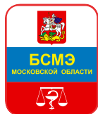
Государственное бюджетное учреждение здравоохранения Московской области «Бюро судебно-медицинской экспертизы»