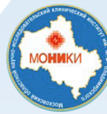
Государственное бюджетное учреждение здравоохранения Московской области Московский областной научно-исследовательский клинический институт им. М.Ф. Владимирского