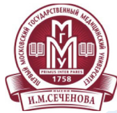
Первый Московский Государственный медицинский университет им. И.М. Сеченова